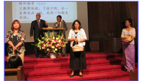
女執事派發送給父親們的小心意禮品：手提電筒